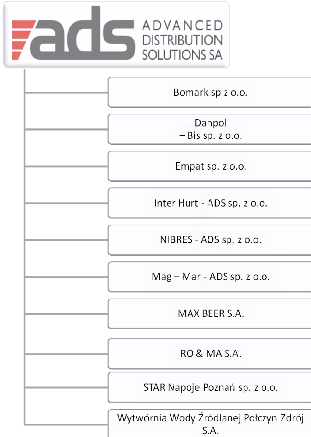
Struktura Grupy Kapitałowej ADS S.A.

Poniższy schemat przedstawia powiązania kapitałowe w Grupie Kapitałowej Advanced Distribution Solutions S.A.